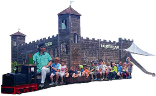
Abenteuerburg: Toben, Klettern, Ritterschmaus

Miniaturmodelle als Anschauungsobjekte. Burgen, Schlösser, Mühlen, ehemalige industrielle Bauten.