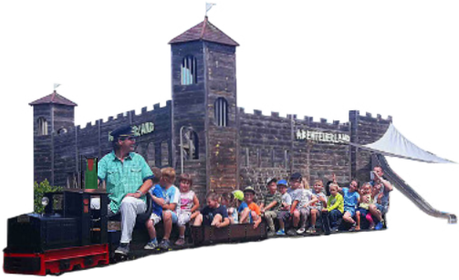
Abenteuerburg: Toben, Klettern, Ritterschmaus

Miniaturmodelle als Anschauungsobjekte. Burgen, Schlösser, Mühlen, ehemalige industrielle Bauten.